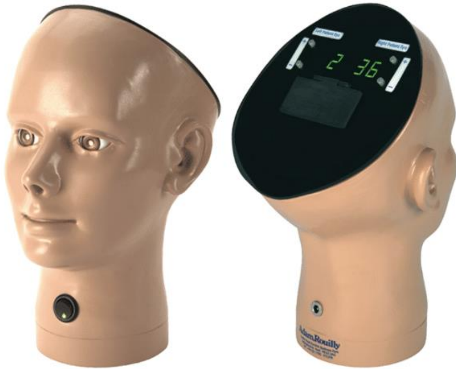
Trenażer – badanie oka