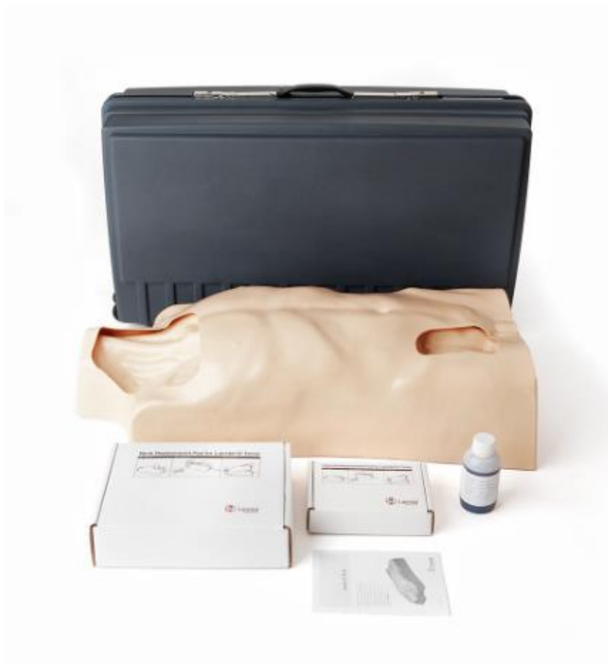
Trenażer – dostępy centralne