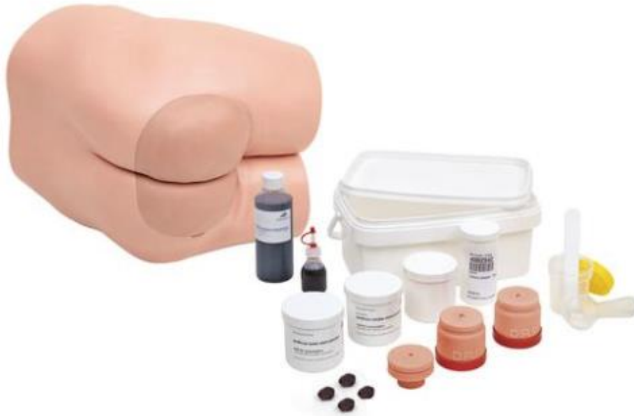
Trenażer do zabiegów dorektalnych